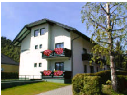
Ferienhaus Nr. 27 in Seelach