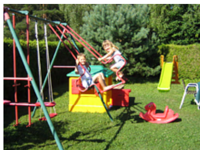
Spielplatz für Ferienhaus19/27